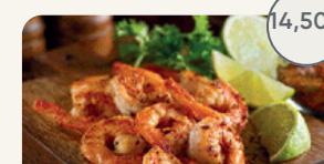
Crevettes sel et poivre